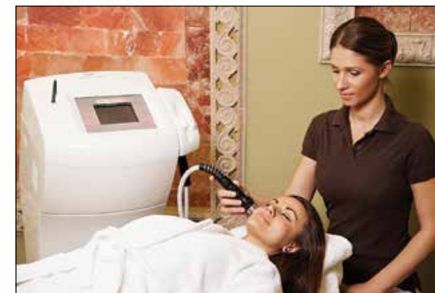
Tretmani lica i tela: Med Visage (gore) i Med Contour (dole)

U hotelu, inače, postoje posebne sobe za tematske masaže: japanske, orijentalne, biljne, istočnjačke, i isto toliko različitih, tematskih sauna. Svaka masaža, svaka sauna ima svoj mirisni i vizuelni ugođaj, i terapeutsko dejstvo. Naša preporuka: kombinacija Reviderem mikrodermoabrazije i Med Visage tretmana daje blistavu, čistu i zategnutu kožu.